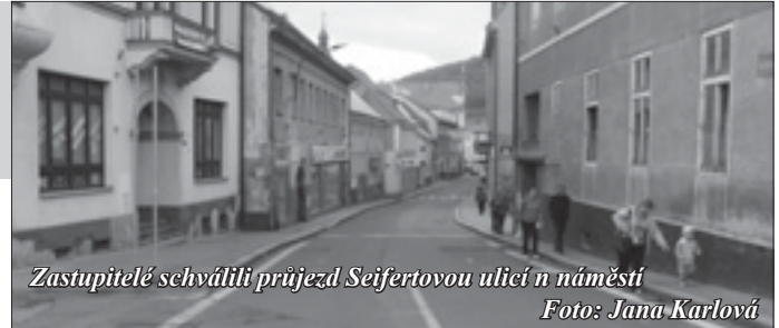
Zastupitelé schválili průjezd Seifertovou ulicí n náměstí

Rozvinula se debata i o bezpečnosti chodců v Seifertově ulici, která je velmi úzká a při průjezdu aut znamená opravdu jisté nebezpečí. Podle odboru dopravy se však to, že je ulice slepá, není řešení: „Ulice je nebezpečná i v tomto stavu. Auta tam vjíždějí a zase vyjíždějí, ulici