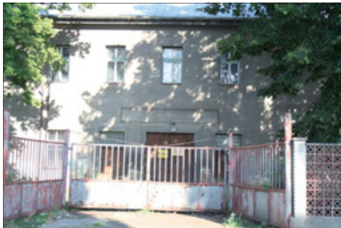
Kasárna jeji deset let prázdnotou. Podaří se s nimi něco udělat?