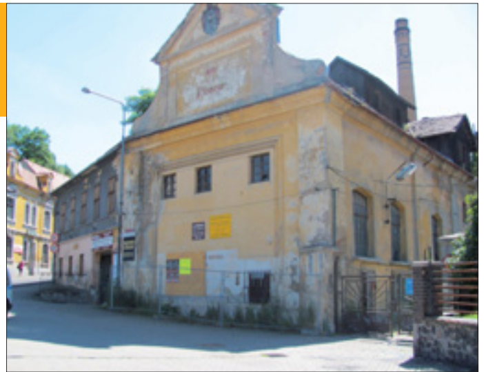
Pivovar už dlouho jenom chátrá

značkou piva, která se výrazně liší od průmyslově vyráběných piv," uvedl pan Stryk. Pokud by rada i zastupitelstvo města záměr firmy posvětilo