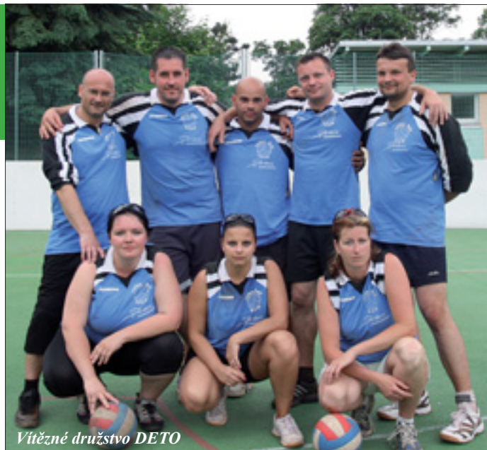
Vítězné družstvo DETO

V tomto ročníku konečně zvíťazil korunní princ minulých let – družstvo DETO, které v závěrečném turnaji uhájilo své těsné vedení z úvodních kol soutěže. Celou soutěží prošlo bez jediné porážky se ztrátou tří bodů za tři remízy 1:1. Největší předností DETO je to, že disponuje větším