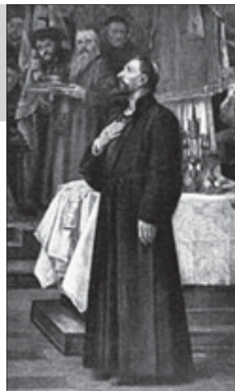
Jan Hus byl významnou postavou českých dějin

Církev ho pronásledovala dál, až ho císař Zikmund vyzval, aby své pokrokové učení obhájil na koncilu ve švýcarské Kostnici. I navzdory glejtu o osobní nedotknutelnosti byl Jan Hus zatčen a odsouzen. Ani poté ho církev nepřiměla odvolat učení, o kterém byl přesvědčen. Nevyhnutelně pro církev proto následovalo Husovo upálení.