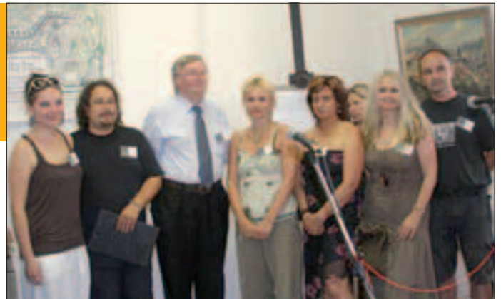
Členové občanského sdružení Bílina 2006 , kteří se na výstavě podíleli

Historie dýchá z obou prostorů určených pro výstavy. Jak ve výstavní síni U Kostela, tak v Galerii pod Věží probíhá po celé prázdniny výstava nazvaná Bílina zmizelá a nalezená . Zatímco U Kostela jsou k vidění nejrůznější předměty související s historií Bílinska, Galerie pod Věží je věnována Gustavu Walterovi, slavnému bílinskému rodákovi, opernímu pěvci, který působil ve vídeňské opeře.