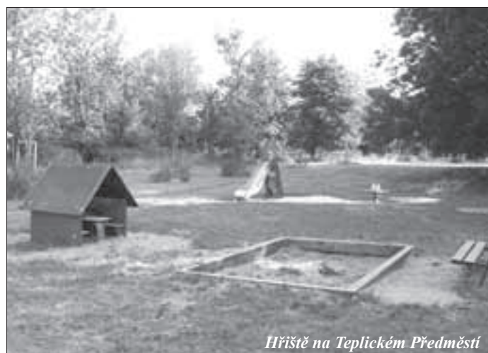
Hřiště na Teplickém Předměstí