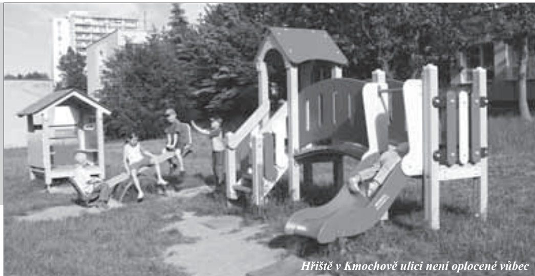
Hřiště v Kmochově ulici není oplocené vůbec