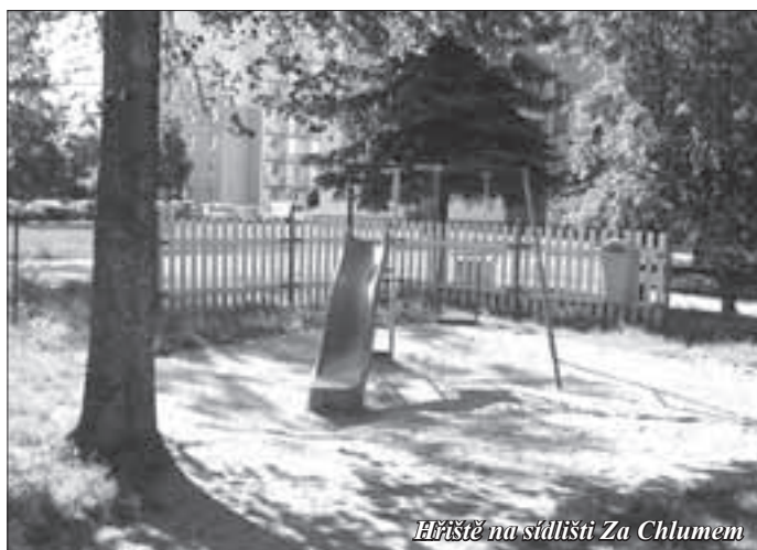
Hřiště na sídlišti Za Chlumem