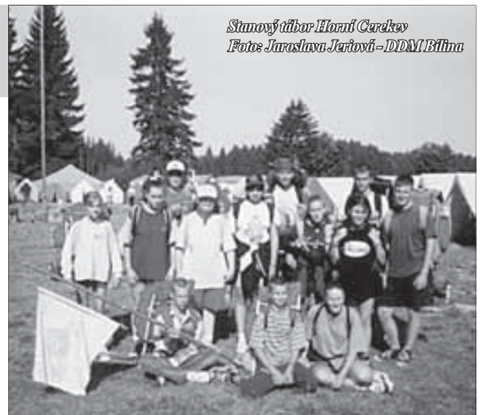
Stanový tábor Horní Cerekev

se správně mluvit na mikrofon. Vše za dohledu profesionálního kameramana a moderátora. Děti si sami reportáž připraví, natočí,