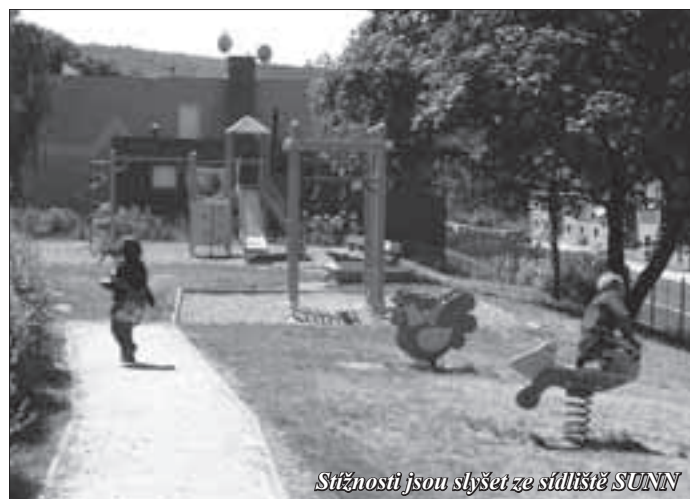
Stížnosti jsou slyšet ze sídliště SUNN