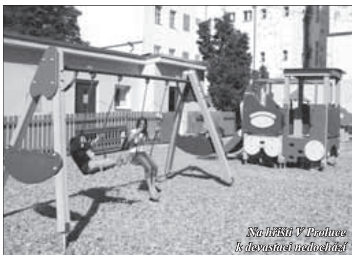
Na hřišti V Proluce k devastaci nedochází