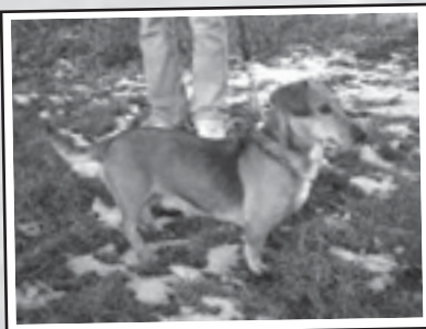
Dáma (místo odchyty: Bílina) – nejspíše kříženec jezevčíka, asi 4 roky stará fena, dobrý zdravotní stav

Zatoulaní psi odchytení v Bílině a okolí se odvázejí do útulku v Jimlíně na Lounsku. Pokud se i vám zaběhl mazlíček, může být právě tam. Na fotografiích představujeme část pejsků z Bíliny a okolí. Najdou svého pána? Jistě budou vděční i za nového majitele, který o ně bude dobře pečovat.