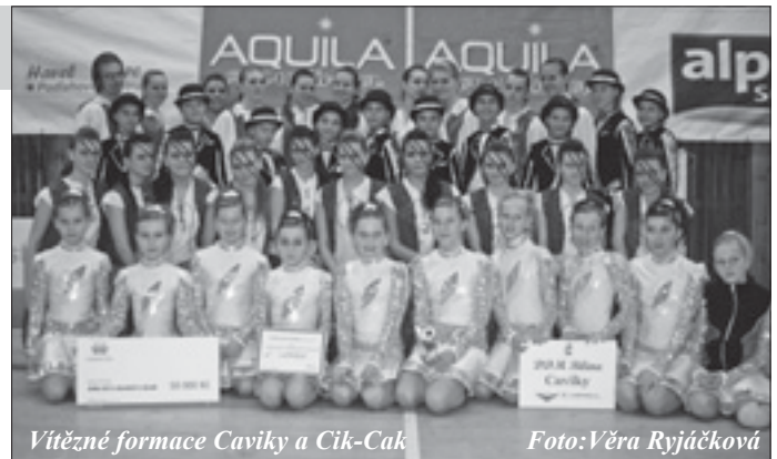
Vítězné formace Caviky a Cik-Cak