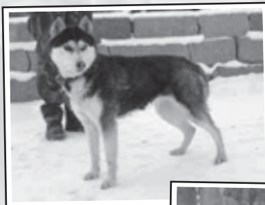
Haska (místo odchyty: Bílina) – nejspíše husky, asi rok a půl stará fena, dobrý zdravotní stav