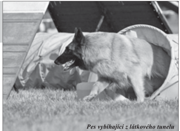
Pes vybíhající z látkového tunelu

Kdo se chce stát členem klubu, musí absolvovat deset tréninků. Rozplánované jsou vždy na pondělní odpoledne, v zimě však tréninky plánuje počasi. Během půl roku získal klub takto pět členů