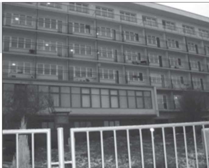
Domov důchodců v Bystřanech

Loni činil tento příspěvek dvacet tisíc korun. Domov důchodců požádal Bílinu o tuto částku, aby mohl koupit lehátko pro špatně pohyblivé či nepohyblivé obyvatele domova, a Bílina jeho žádosti vyhověla. Letos byl dar věnován