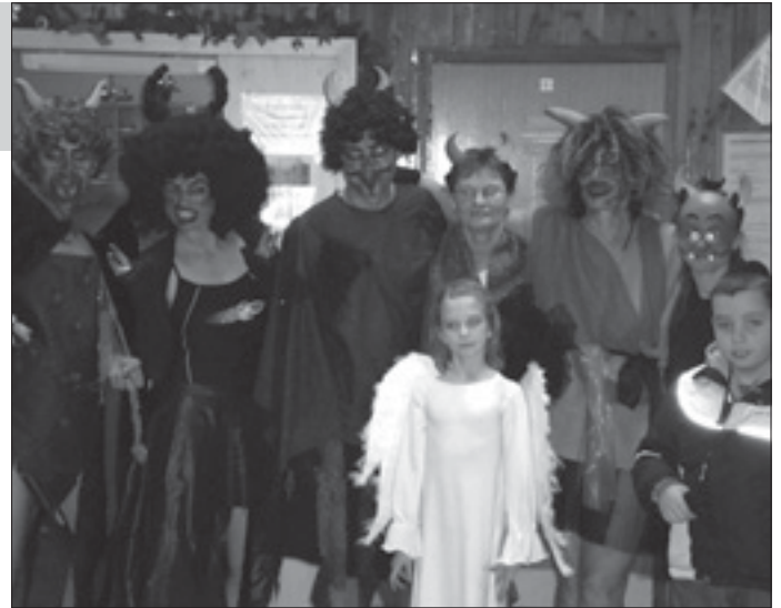
Čerti přišli i do plavecké haly

Věříme, že jsme pro zdárný průběh i propagaci udělali maximum. Vždyť se platilo pouze běž-