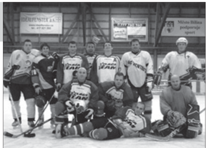
Poražený finalista - Sláča Team

proti sobě nastoupila mužstva Sláča Team a SPORTBAR 24H a ve druhém semifinálovém utkání se utkala mužstva Radio Most a FACTOR Most. V dramatickém utkání o finále porazil Sláča Team svého soupeře 2:1 a ve druhém utkání Radio Most zvítězilo nad svým soupeřem 6:4. V boji o třetí a čtvrté místo porazilo mužstvo FACTOR MOST - SPORTBAR 24H 6:3. Ve finále se střetli soupeři, kteří proti sobě nastoupili v základní skupině A, a to Sláča Team a Radio Most. Zápas stejně jako v základní skupině skončil nerozhodně 4:4 (v prvním utkání 2:2) a o vítězi rozhodovaly samostatné nájezdy. Tentokrát bylo úspěšnější mužstvo Radio Most, které proměnilo všechny nájezdy. Za Sláča Team neproměnil rozhodující samostatný nájezd nejlepší střelec turnaje