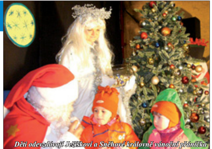
Děti odevzdávají Ježíškovi a Sněhové královně vánoční přáníčka

žíšek na zahradě DDM Bílina konal v roce 2004, kdy všichni přítomní najednou rozsvítili nejen vánoční stromček, ale i svoji svíčku.