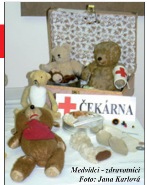
Medvídci - zdravotníci

Osloveným návštěvníkům se na výstavě líbí: „Je to kouzelný pocit setkat se s kouskem svého dětství po letech, protože i toho svého medvídka jsem tu našel, a navíc vedle sebe s někým blízkým, který je zároveň vzdálen mému dětství,“ uvedl například jeden z nich.