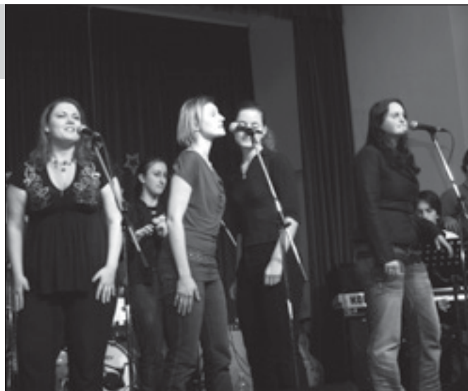
Jedna z vystupujících kapel Kolečkový dům

Marcel Flemr Band se zas hlásí k hlubším kořenům elektrického blues, se zřejmou inspirací kytarovými mistry jako