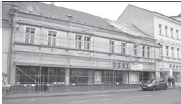
Budoucí budova pošty na Mírovém náměstí