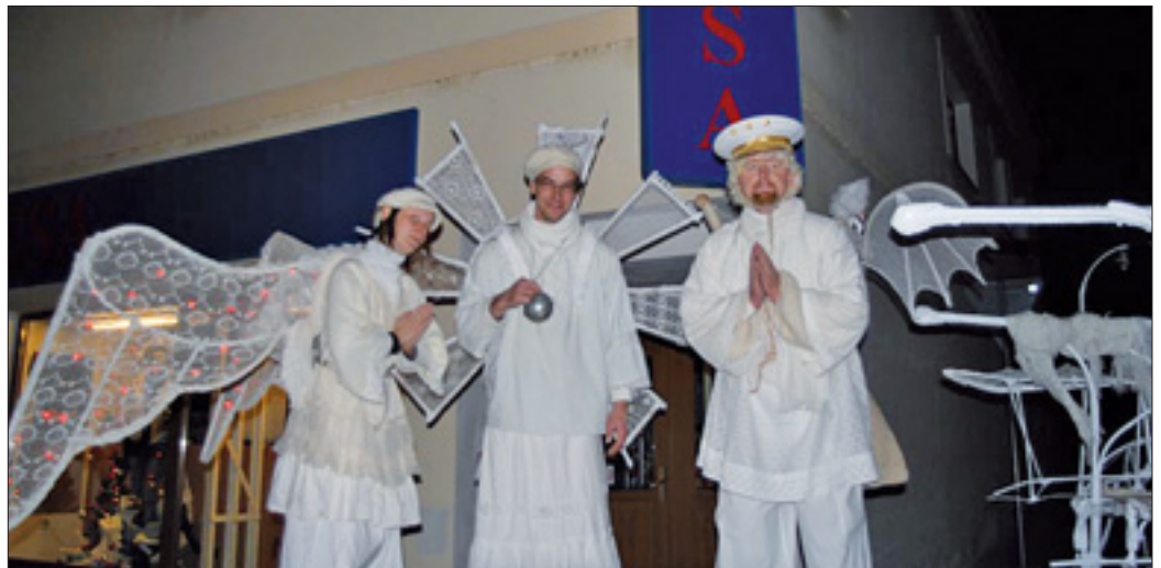
Zjevení andělů tančících na chůdách