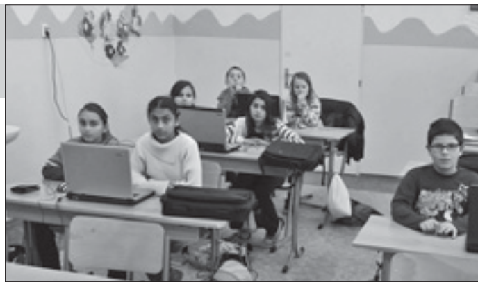
Kroužek mediální výchovy

Pěvecký kroužek se nám postupně rozrostl a z původně vánočního sboru se nám stal pravidelným