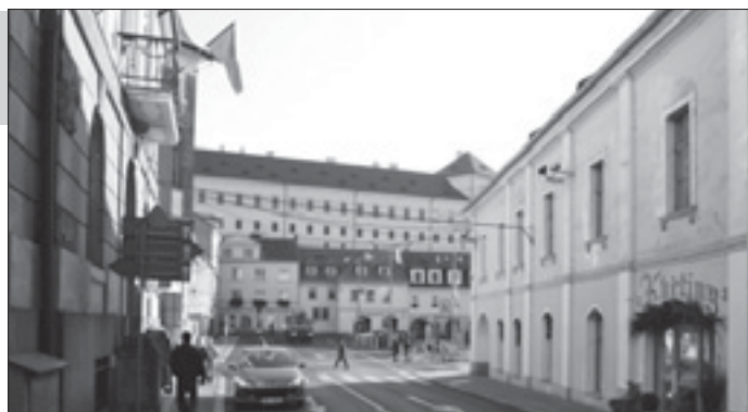
Břežánská ulice bude uzavřena

Uzavření Břežánské ulice i přesun zastávky bude platit po celou