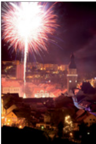
Závěrečný ohňostroj byl velmi povedený