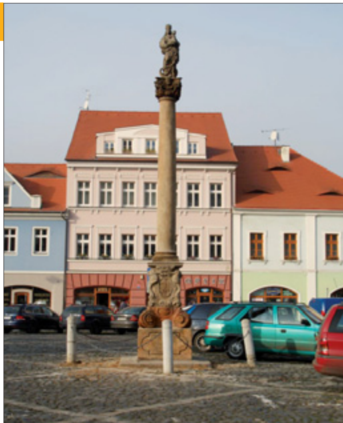
Zrestaurovaná Socha Panny Marie stojí již zase na svém místě