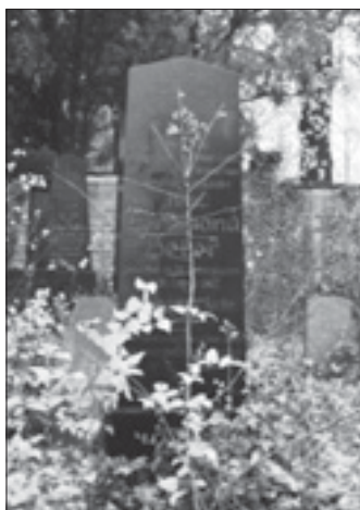
Náhrobek na Židovském hřbitově.