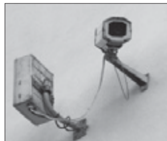
Do situační prevence jsou zahrnuty také kamery